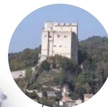
La Tour de Crest