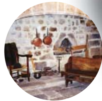
Le Musée de la Châtaigneraie Joyeuse