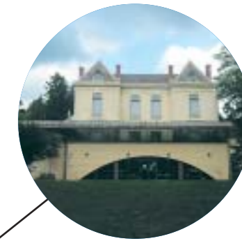
La Maison de la Terre Dieulefit